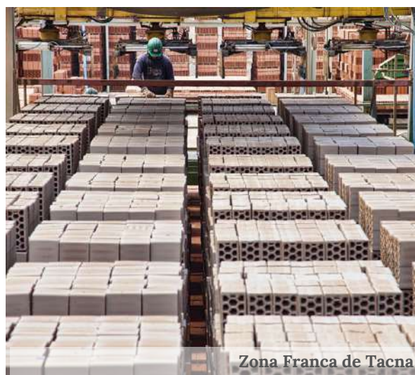
Zona Franca de Tacna