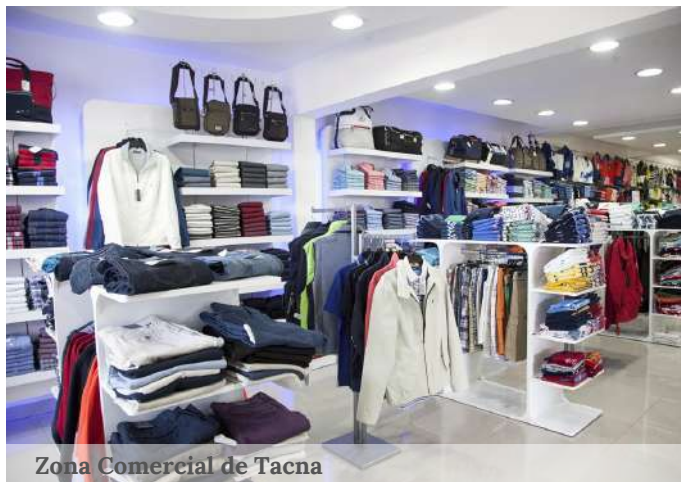
Zona Comercial de Tacna

Asimismo, las importaciones al resto del territorio nacional totalizaron US$ 93.7 millones en el tercer trimestre, registrando un incremento del 87% con respecto al año previo, de los cuales ZED Ilo tuvo una participación de 57% del valor total.